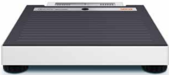
Matala rakenne ja vaa'an pinta joka on tehty liukastumattomasta materiaalista tekevät vaa'asta tukevan ja helposti päälle astuttavan.

Hyvä nimi ansaitaan laadun ja nykyaikaisen toiminnallisuuden kautta. Siksi olemme nimenneet vaa'an lääkäri vaa'aksi. Nimi kertoo siitä lisäarvosta jonka tuote antaa ammattilaiselle. Tarranimikilven „doctor scale” tilalle voidaan tehdä yksilöllinen tarranimikilpi joka identifioi vaa'an ja sen antamat punnitustulokset esim. Tiettyyn osastoon tai huoneeseen. Lisätietoa yksilöllisistä tarranimikilvistä vaakaan: www.seca.com/doctorscale .