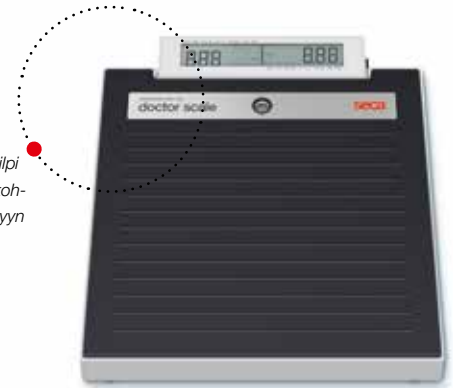
Yksilöllinen tarranimikilpi mahdollistaa vaa'an kohdistamisen esim. tiettyyn huoneeseen.