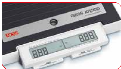
Kaksi jalkakytintä vaa'an etuosassa mahdollistavat helpon käytön säästäten selkää.

Pääset web-sivuille myös tämän QR koodin avulla.