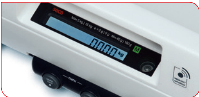
Uusi taustavalaistu nestekidenäyttö takaa, että tulosten lukeminen on helppoa myös hämärissä tiloissa.