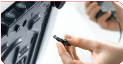
Toimii uudelleen ladattavalla akulla tai verkkovirralla.

Vauvat voivat välillä olla rauhattomia, mutta seca 757:n kanssa se ei häitää. Vaikka vauva liikkuu punnittaessa, vaa'an erittäin herkkä punnitustekniikka takaa tarkat mittaustulokset sekunneissa. Vaimennustoiminto vaimentaa liikkeestä johtuvan vaihtelun punnittaessa ja antaa tarkan punnitustuloksen. Hoitaja voi keskittyä täysin punnitsemiseen.