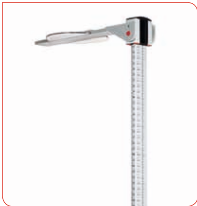
Die seitliche Bedruckung ermöglicht ein optimales Ablesen der Körpergröße.

Schwergewichtige oder adipöse Patienten haben es auf der seca 704 s leicht, denn die große, flache Plattform macht das Begehen einfach und sicher. Nichts wackelt, nichts gefährdet den sicheren Stand. Dafür sorgen ein massives Untergestell aus Gusseisen sowie eine rutschsichere Auflage aus geriffeltem Gummi.