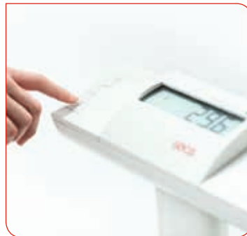
Mit der seca 360° wireless Funktechnologie kann die seca 704 s auf Knopfdruck jeden Messwert an einen optionalen seca Funkdrucker oder an die seca Software auf Ihrem PC versenden.

Sie wollen einen gespeicherten Wert, z.B. der Kleidung, vom Gewicht des Patienten abziehen? Kurz Pre-TARA drücken. Oder ein Kind auf dem Arm eines Elternteils wiegen? Mit der Mutter/Kind-Funktion. Jetzt schnell den Messwert speichern, um ihn erst später abzulesen? Wie gut, dass es hier die HOLD-Taste gibt. Und wenn gewünscht, kann Auto-HOLD über das Menü aktiviert werden.